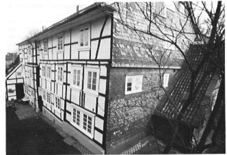
Abb. 2 Teschemachers Wohnhaus in der Elberfelder Mirke. Errichtet um 1640. Rechts vermutlich ein Teil der Orgelbauwerkstatt Teschemachers. Zustand 1979.

Nach dem Konzert wandern wir gemeinsam am Teschemacher-Haus vorbei durch den Mirker Hain zur Philippuskirche, Kohlstraße.